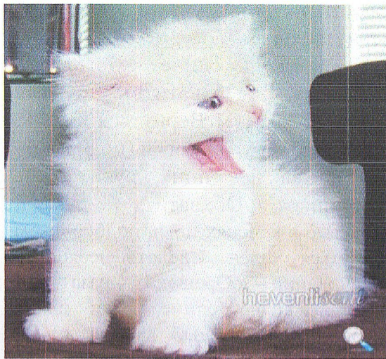
Гимнастика после сна

последовательность и осознанно выполнять комплекс.