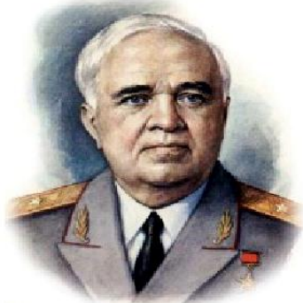
Композитор Александр Васильевич Александров

Утверждён 25 декабря 2000 (музыка) 30 декабря 2000 (слова)